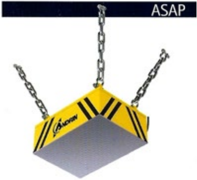
Suspensions-Elektromagneten für Förderer [400 - 2400 mm]