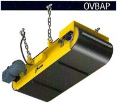
Overband Elektromagneten für Förderer [400 - 2400 mm]