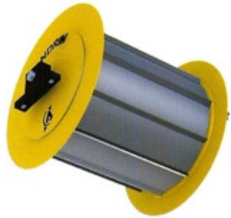
elektromagnetische Trommeln [Ø 320 - 1800 mm / Breite 400 - 3000 mm]